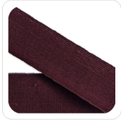
Bordeaux - 89