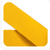
Giallo Sole - 64