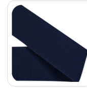
Loden - 177