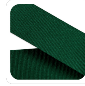
Bottiglia - 132