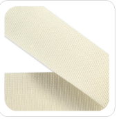
Panna - 37