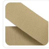
Biscotto - 140