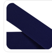
Blu - 115