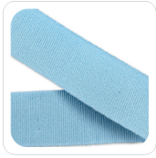
Celeste - 105