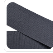
Grigio - 47