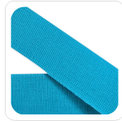
Tuchese - 110