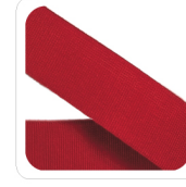
Rosso Geranio - 92