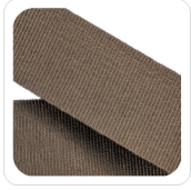
Castoro - 168