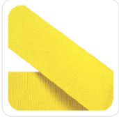
Limone - 59