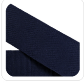
Blu Notte - 117