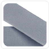
Perla Scuro - 48