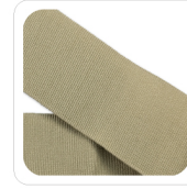
Sabbia - 136