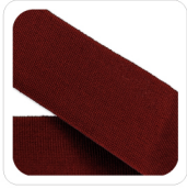
Amaranto - 88