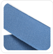
Azzurro - 104