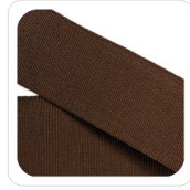
Caramello - 98