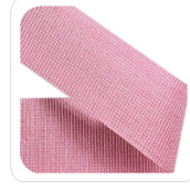
Rosa - 74