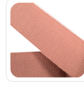
Rosa Antico - 79