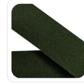
Muschio - 175