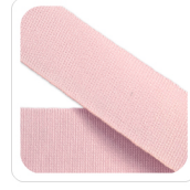
Rosa Baby - 73