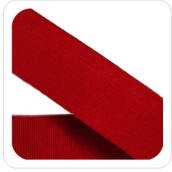
Rosso - 84