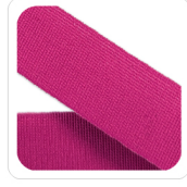
Fuxia - 71