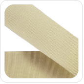
Crema - 149