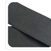
Acciaio - 42