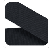
Antracite - 56