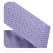
Lilla - 153