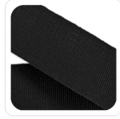
Nero - 41