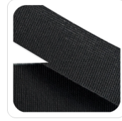
Grigio Scuro - 52