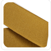
Cognac - 67