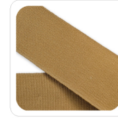
Cammello - 143