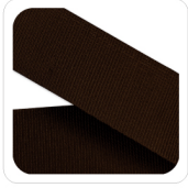
Testa di Moro - 99