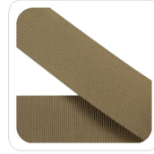
Nocciola - 142