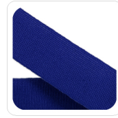
Bluette - 113