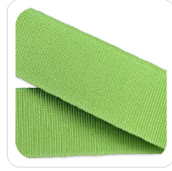
Mela - 100