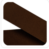
Caffè - 101