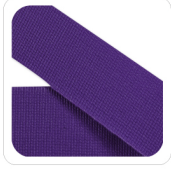
Viola - 157