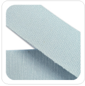
Cielo - 102