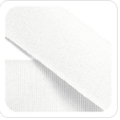
Bianco - 40