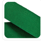
Verde - 121