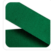
Bandiera - 127